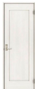
シングルドア S-VP ホワイト色 CDS43VP-D-WH