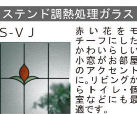
スタンド調熱処理ガラス S-V J 赤い花をモチーフにしたかわいらしい小窓が部屋のアクセントに。リビングからトイレ・個室などにも最適です。