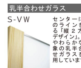
乳半合わせガラス S-V W センターに光のラインを作る「縦2方框デザイン」。やわらかな印象の乳半合わせガラスを使用しています。