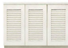
ルバー B401 床置 ピノアース ホワイト色 Q1SX4B-L7-WH