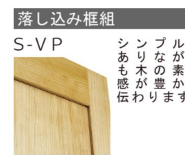
落とし込み框組 S-V P シンプルながらも木の素材感が豊かに伝わります。